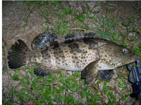
Mú đen chấm nâu/mú cộp ( Epinephelus coioides )