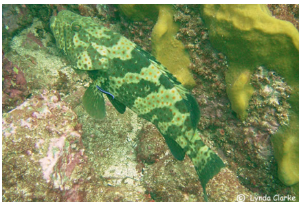
Cá mú mè/chấm hạt tiêu Malabar Grouper ( Epinephelus malabaricus )