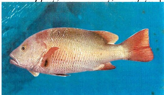
Cá hồng (Red Snapper)