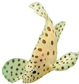
Cá mú chuột ( Cromileptes altivelis )