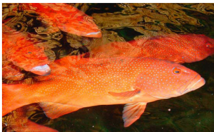
Cá mú đỏ chấm xanh Leopar grouper ( Plectropomus leopardus )