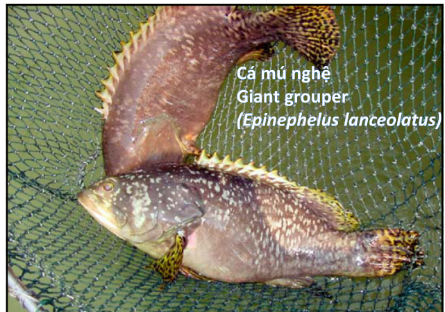
Giant grouper at a Johor marine fish farm.