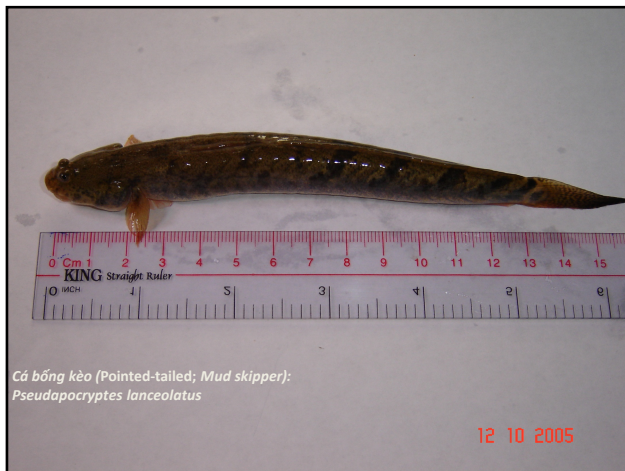
Cá bống kèo (Pointed-tailed; Mud skipper); Pseudapocryptes lanceolatus