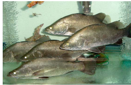
Cá chẽm/cá vược Seabass/Baramundi ( Lates calcarifer )